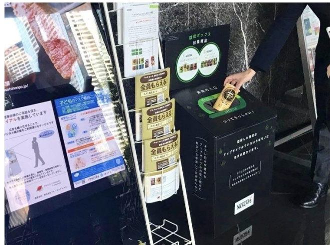
回収ボックスの設置イメージ