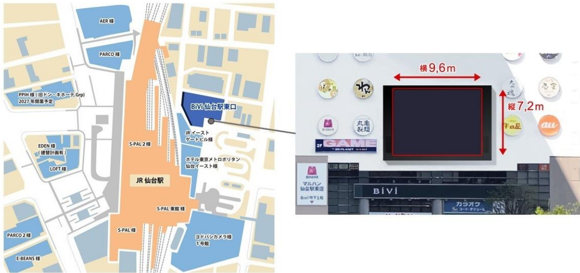
【左：BiVi ビジョン仙台の設置場所 右：サイズイメージ図】