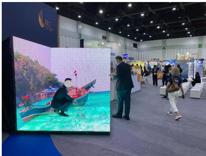
イマーシブ XR ディスプレイの様子（本イベント会場にて撮影） 床の LED ビジョンに乗り上げていただくことも可能で、より没入感のある映像体験を提供します。

「イマーシブXRディスプレイ」は、EEC事務局の発注に基づき、来場者へのEECの革新性を印象付ける新たな映像体験の提供を目的に、イベント会場中央のメインステージ前に導入されています。今回の導入が、タイ現地法人による初めての「イマーシブXRビジョン」及び「デジフロー」の導入事例となります。今後もタイ現地法人では、現地のニーズに基づき、最先端テクノロジーで心躍る未来の実現を目指して参ります。