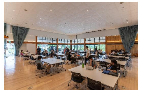
左：学会開催日前後の人流データ。 右：学会当日の昼食会場としての利用状況。