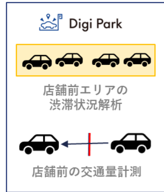
Lotus's Bang Na 店での「デジパーク」による店舗前道路の混雑状況分析のイメージ

本取り組みにより、例えば、来店者数が少ない時間帯には店舗内での買い回りを促すプロモーションを実施する、店舗前道路の渋滞時間帯には、車内から注文が可能なオンライン注文を促すプロモーション広告を放映するといった、リアル空間の状況に応じたマーケティングが可能となります。