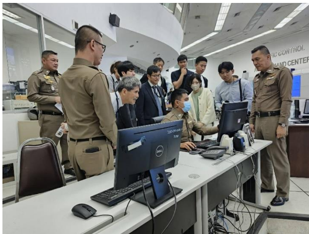
（写真右）タイ警察の交通コントロールセンターにて現行の運用をヒアリング