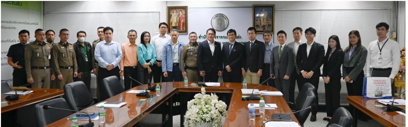
(写真) 日本政府国交省・バンコク都・タイ警察を交えてのキックオフ MTG の様子 (2023 年 11 月 15 日開催)

ニューラルグループ株式会社 (以下、「当社」) は、国土交通省による2023年度 Smart JAMP 交通分野におけるスマートシティ実現に向けた調査検討業務 (以下、「本件業務」) を受注しましたので、お知らせします。