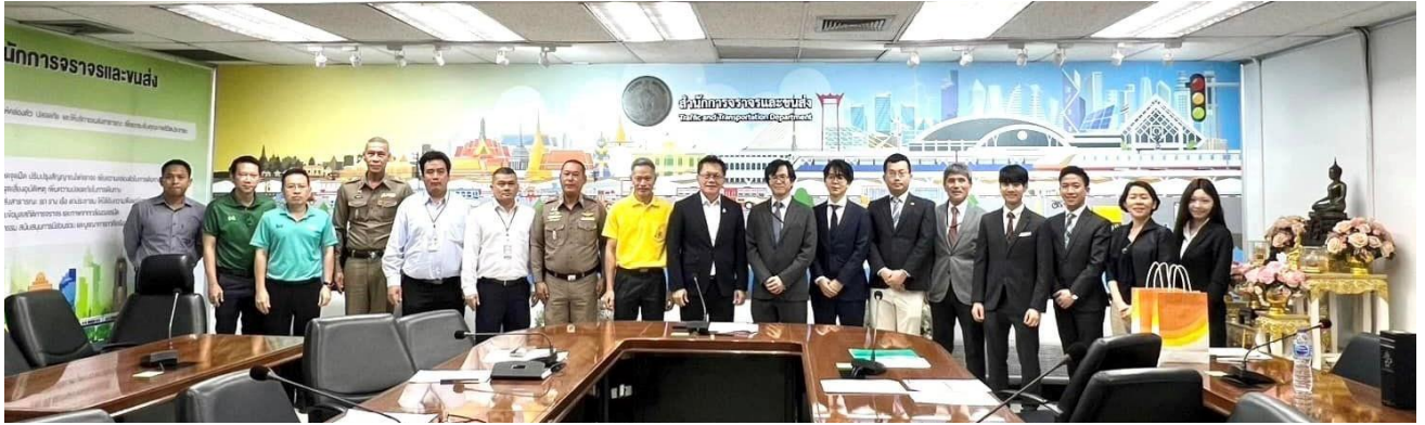
(写真) 日本政府国交省・バンコク都・タイ警察を交えたのキックオフ MTG の様子 (2024年7月10日開催)

ニューラルグループ株式会社 (以下、「当社」) は、昨年度に引き続き、本年度も国土交通省によるSmart JAMP 交通分野におけるスマートシティ実現に向けた調査検討業務 (以下、「本件業務」) を受注しましたので、お知らせします。