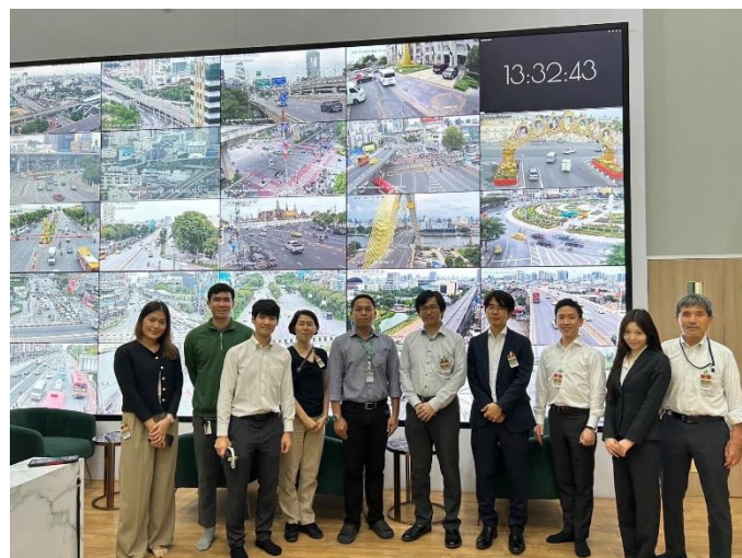
(写真右) バンコク都交通コントロールセンターにて、CCTV カメラ映像のリアルタイム連携についてヒアリング