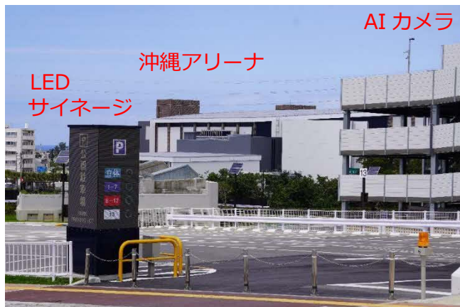
左 システムの全貌