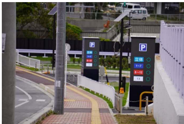
左 公道からみた駐車場の案内

取得された満空情報は、沖縄セルラー電話株式会社、OTNet 株式会社とニューラルマーケティングの協業により駐車場内の出入口や分岐点 7 か所に設置された LED サイネージに表示され、空いているエリアの案内などを図ることで、駐車場内の円滑な誘導を図ります。また、出入口の LED サイネージは 4 面構成となっており、イベントや駐車状況に応じて、出口の右左折や通行禁止といった誘導を可変的に促し、駐車場からのより早い退出に寄与します。さらに、沖縄市内観光施設の PR 動画の放映などを行い、観光客や公園利用者とのコミュニケーションを創出して、市内観光の促進に貢献します。