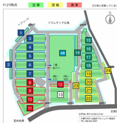
右：WEBページではより詳細に満空情報を提供

https://kozasporthpark.digipark.neural-group.com/