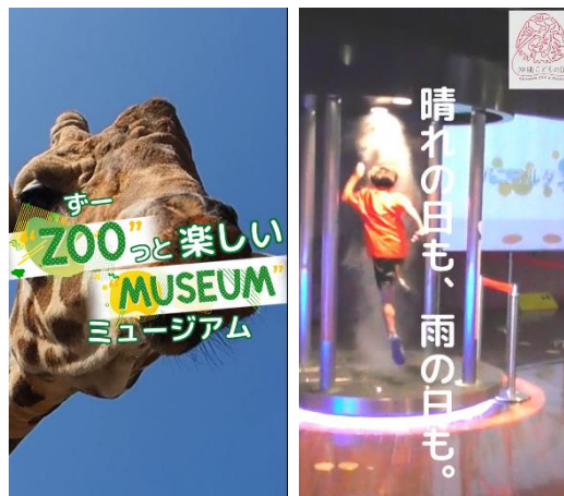
右：沖縄市内施設情報の放映

ニューラルグループおよびニューラルマーケティングは、今後も、最先端エッジAIによる解析技術と新時代のコミュニケーションツールであるLEDサイネージを組み合わせた様々なサービスを創出し、地域課題解決や観光振興などを通じた地域社会の発展により一層貢献してまいります。